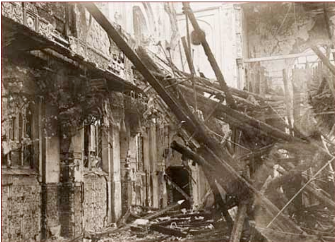
Synagoge na de Kristallnacht

Na de moord op Een Duitse diplomaat in Parijs door een Jood trekt er een golf van geweld door Duitsland, waarin vele synagogen inde fik gestoken worden. Duizenden Joodse winkels worden vernield, 30.000 Joden opgepakt worden en naar concentratiekampen gestuurd, Enkele honderden Joden worden deze nacht vermoord. De daders hebben niets te vrezen.