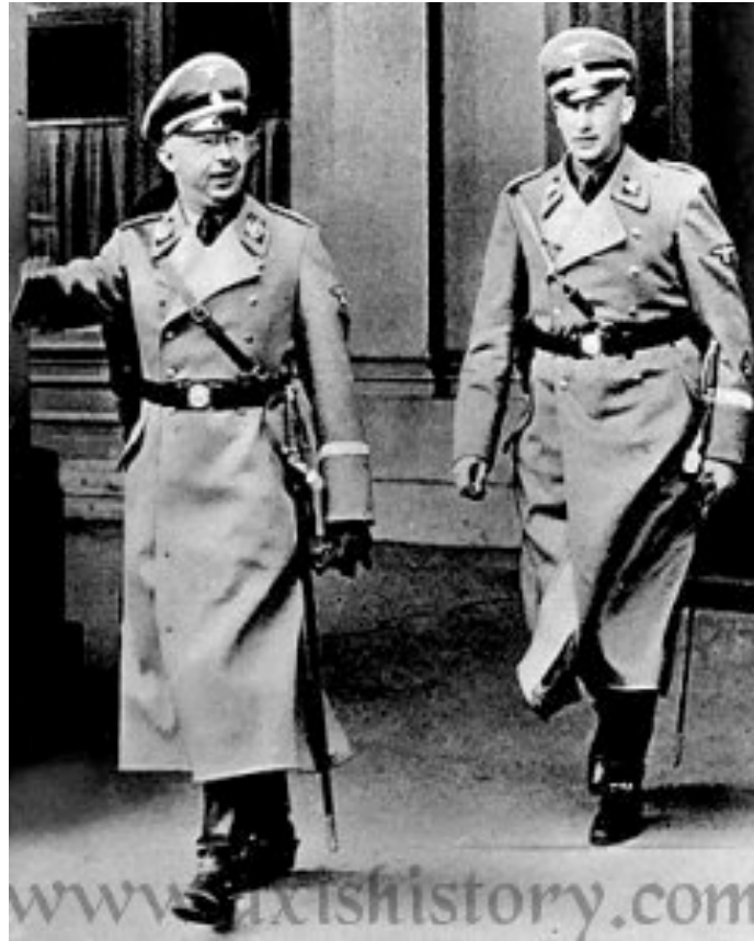
Leider van de S.S. en de Gestapo, Heinrich Himmler en Reinhard Heydrich

Het uiteindelijke besluit werd genomen op de Wannsee-conferentie, januari 1942. Hier bij Berlijn waren belangrijke Nazileiders bijeen en namen daar het besluit tot systematische vernietiging in de zogenaamde vernietigingskampen. Europa zou van west naar oost zo snel mogelijk 'judenfrij' gemaakt worden. De conferentie stond onder leiding van de SS'ers Heydrich en Eichmann.