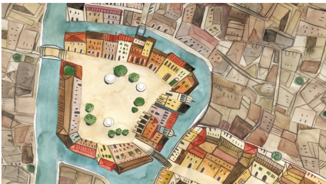
1 e ghetto uit de geschiedenis is het Joodse ghetto in Venetië.