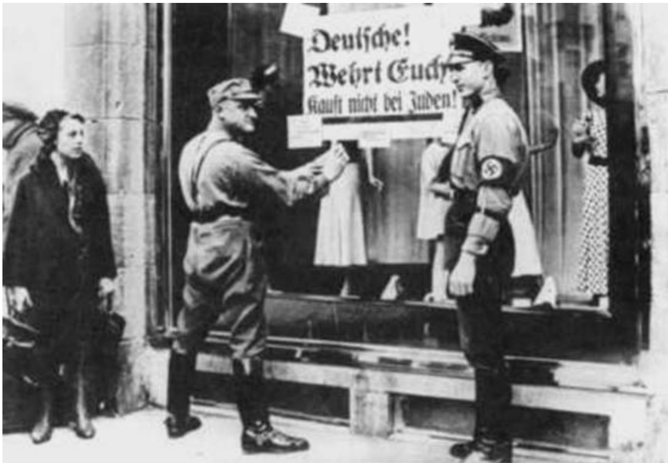
“Duitsers, verdedig je. Koop niet bij Joden”

De eerste echte daad tegen de Joden was de oproep van 1 april 1933 alle winkels en bedrijven van Joden te boycotten. Kort daarop mochten Joden niet meer als ambtenaar voor de overheid werken. Bij de boekverbrandingen van begin mei belandden alle boeken van Joodse schrijvers op de verschillende brandstapels. De toon was gezet. Vele Joden begonnen Duitsland te verlaten.