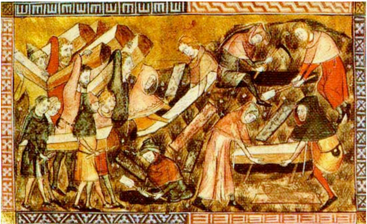
De pest in Europa

In de 15 e eeuw werd Europa getroffen door een enorme pestepedemie. De bevolking van talloze steden werd gehalveerd. De angst was gigantisch. Weer zoekt men een zondebok. Waar komt die ziekte vandaan. Al snel krijgen de Joden de schuld van de verspreiding van die ziekte. Men ziet er een Joods complot in om op deze wijze de christenen te treffen en op die manier de macht te grijpen. Dit terwijl Joden net zo hard getroffen werden door die ziekte als elk ander mens. Vele oorlogen, revoluties en nederlagen werden op zo aan de Joden toegeschreven.