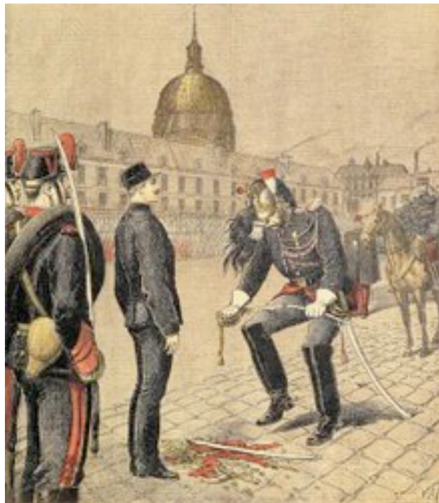
Dreyfus-affaire in Frankrijk

Spraakmakend hierin was de zogenaamde Dreyfus-saffaire in Frankrijk rond 1900. Hij was een officier in het Franse leger en werd beschuldigd geheime documenten doorgespeeld te hebben aan de Duitsers, dus was hij een verrader. Deze beschuldiging klopte van geen kanten, in feite zo bleek later had iemand anders dat gedaan. Dreyfuss was echter een Jood en daarom geloofden velen, dat hij het wel gedaan moest hebben. Dit leidde weer tot een golf van antisemitisme in de Franse pers en opinie. Dreyfus werd op grond van valse verklaringen tot levenslange gevangenisstraf veroordeeld.