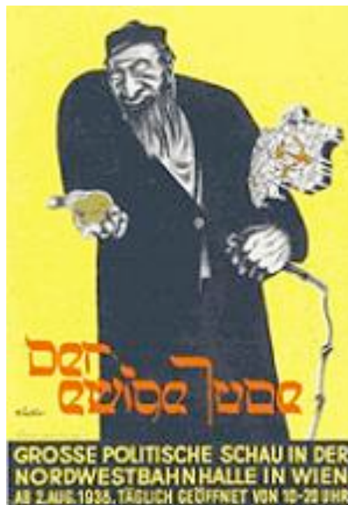
Affiche van de antisemitische film 'der Ewige Jude' door de Nazi's gemaakt in 1940