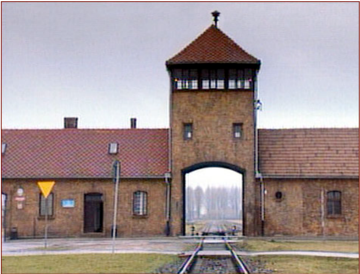
Ingang van Auschwitz