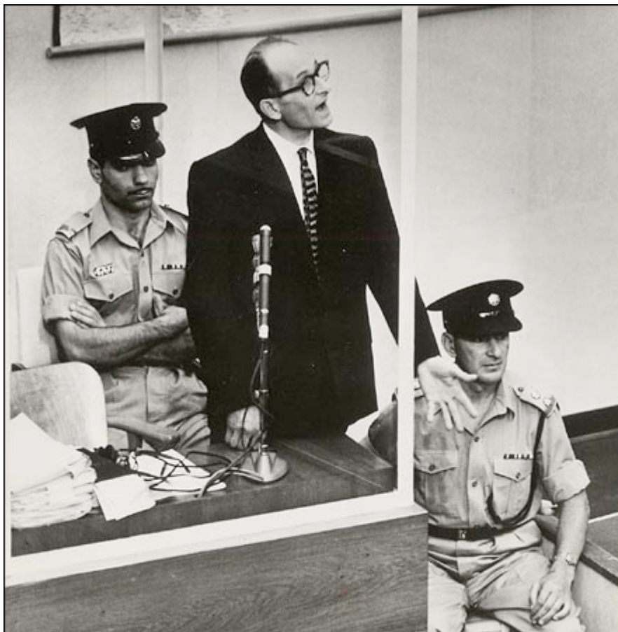
Adolf Eichmann voor de rechtbank in Israel

De Israëliëse geheime dienst, de Mossad, ontvoerde Eichmann en wist hem per vliegtuig naar Israel te brengen. Na een proces werd Eichmann in 1962 opgehangen.