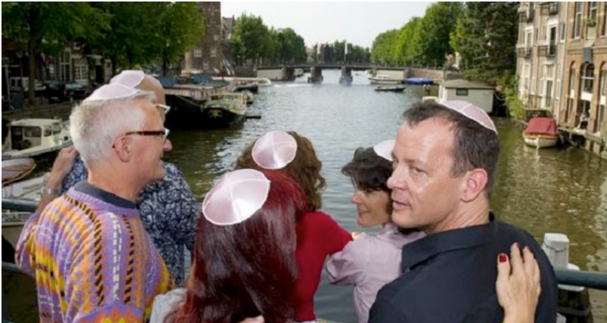
Joden in Nederland, een voorbeeld van de diaspora